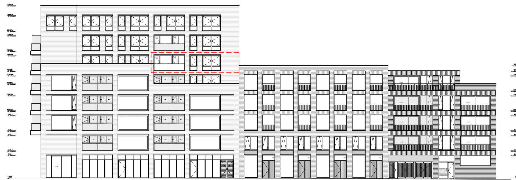
langgevel - oost schaal 1:300