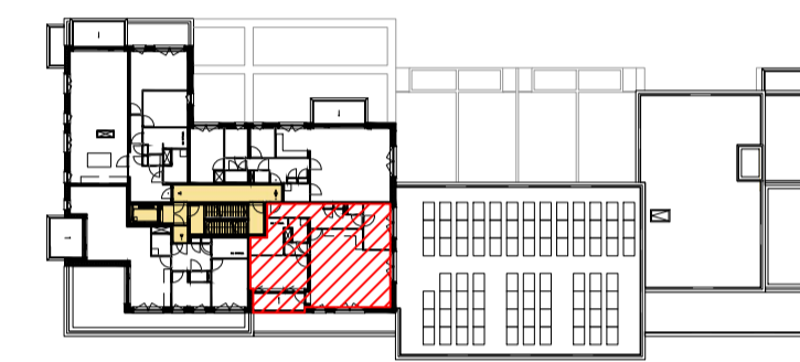
vijfde verdieping schaal 1:750