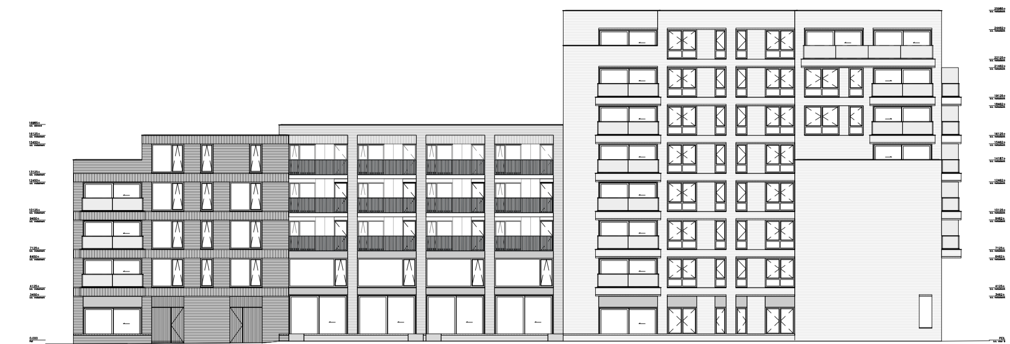
langgevel - west schaal 1:300