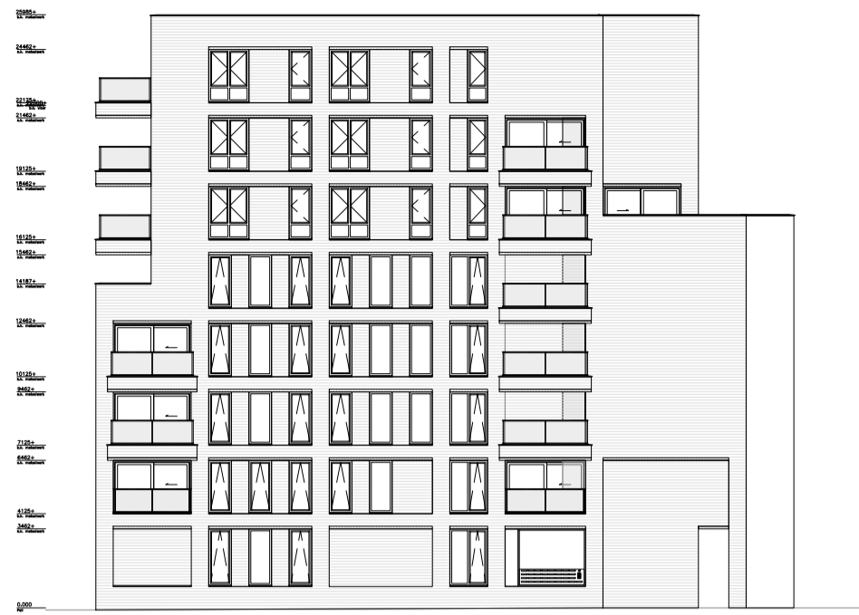
zijgevel - zuid schaal 1:300