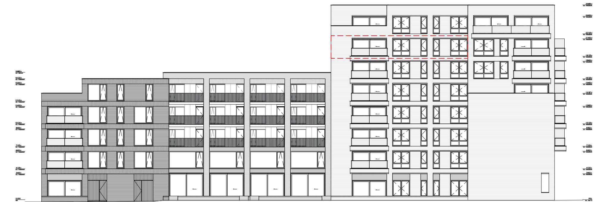
langgevel - west schaal 1:300