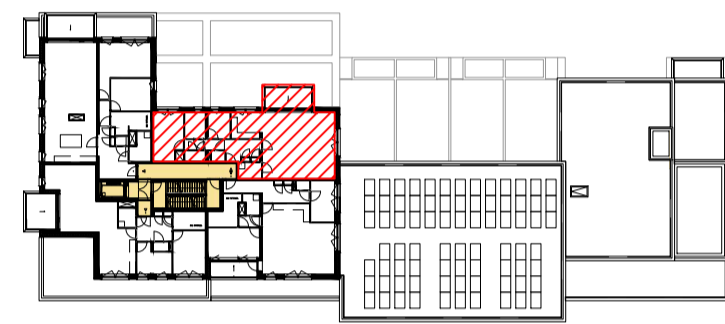
zesde verdieping schaal 1:750