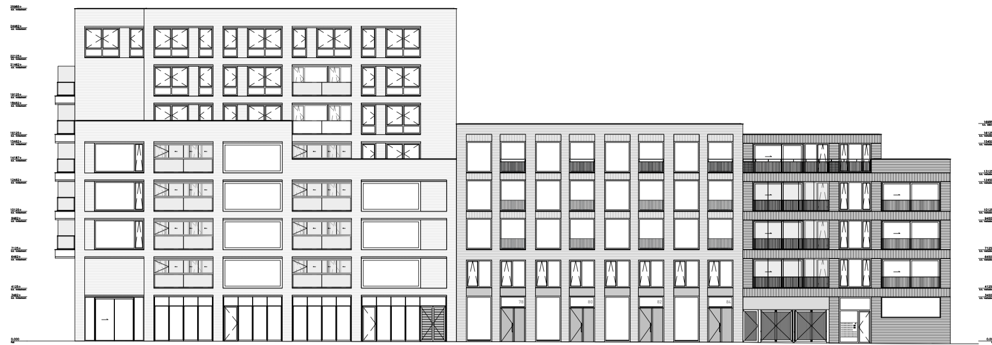
langgevel - oost schaal 1:300