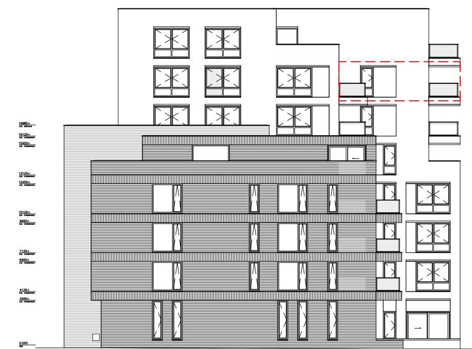
zijgevel - noord schaal 1:300