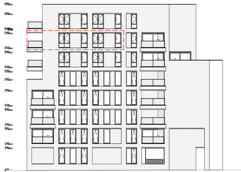
zijgevel - zuid schaal 1:300