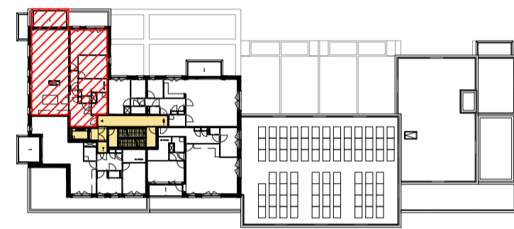
zesde verdieping schaal 1:750